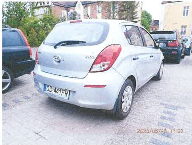
Fot. 4 P5150004

Biuro Rzeczoznawstwa Samochodowego, Ruchu Drogowego, Wyrzyny Maszyn i Urządzeń inż. Mirosław Kolomański 83-200 Starogard Gdański NIP 5921333928