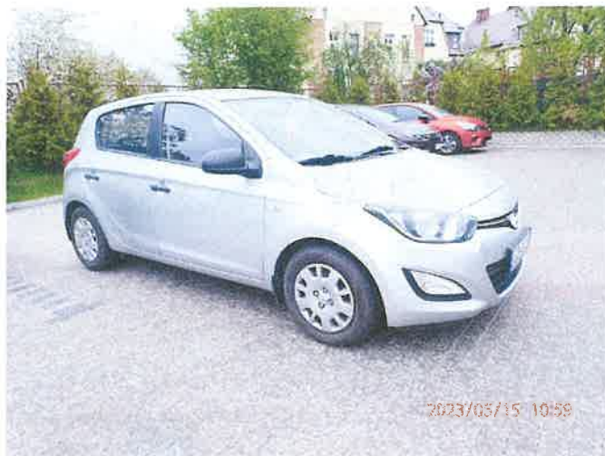
Fot. 1 P5150001