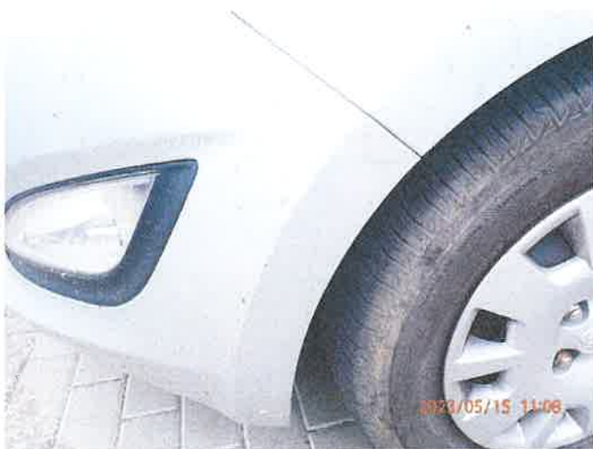
Fot. 27 P5150043