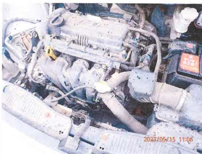
Fot. 18 P5150033