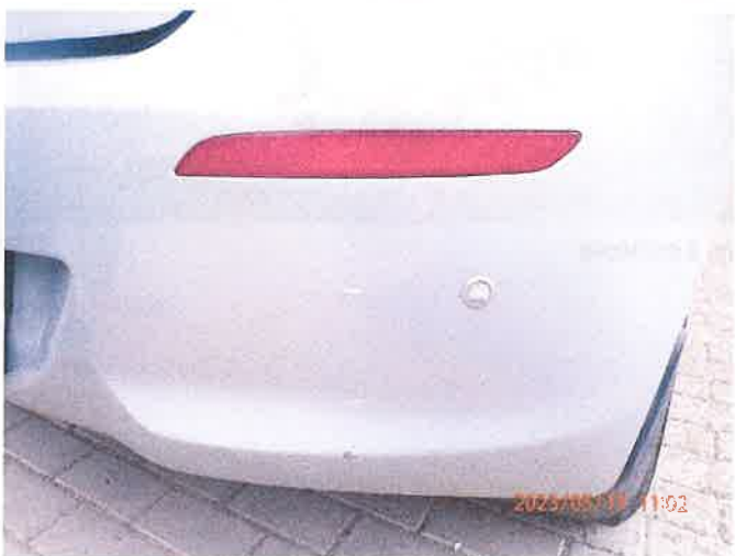
Fot. 9 P5150021