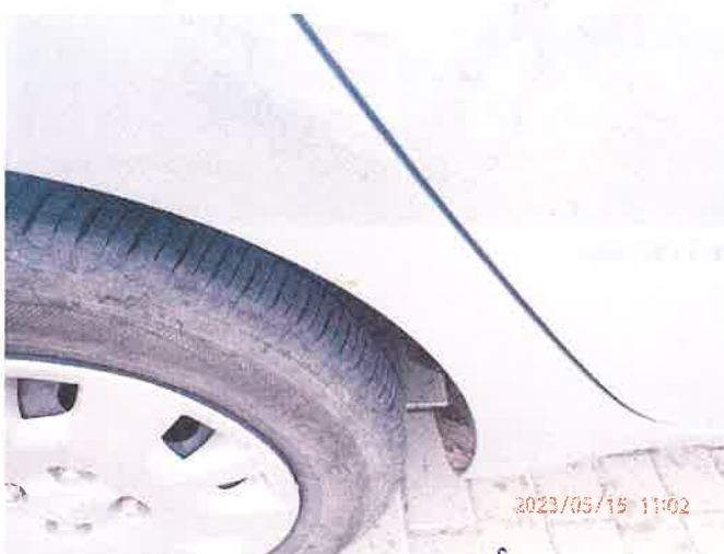
Fot. 10 P5150022

Biuro Rzecznictwa Samochodowego, Ruchu Drogowego, Wzrostu Maszyn i Urządzeń inż. Mirosław Kołomański 83-200 Starogard Gdański NIP 1921333663