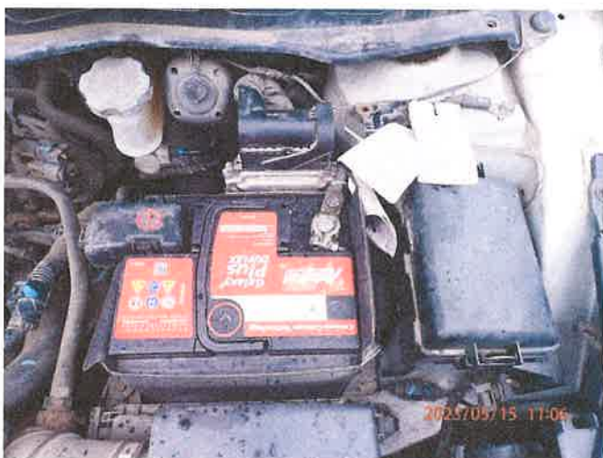
Fot. 19 P5150034