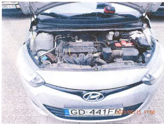
Fot. 17 P5150032