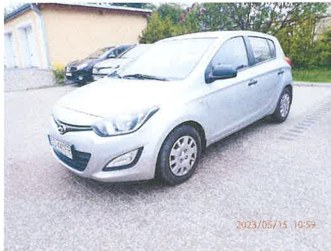
Fot. 2 P5150002