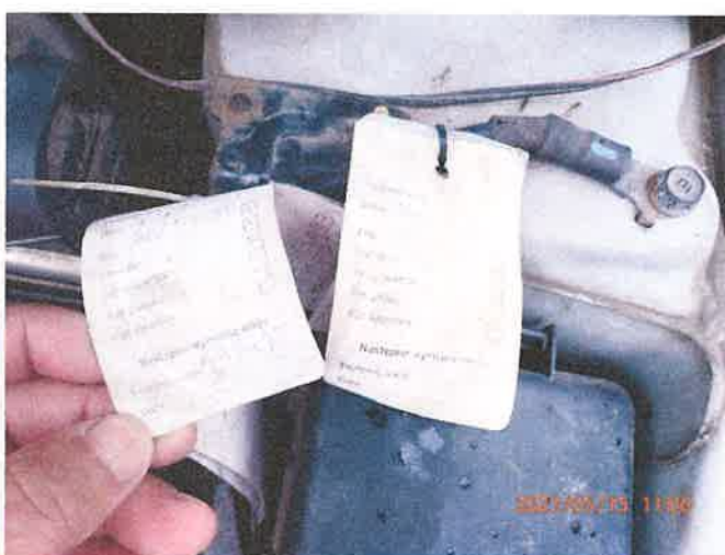
Fot. 20 P5150035