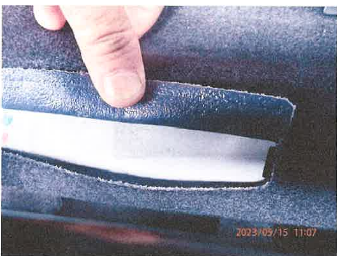
Fot. 21 P5150036