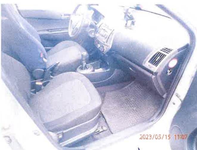
Fot. 22 P5150037

Biuro Rzeczoznawstwa Samochodowego, Ruchu Drogowego, Wyceny Maszyn i Urządzeń inż. Mirosław Kolomański 83-200 Starogard Gdański Nr 592133396