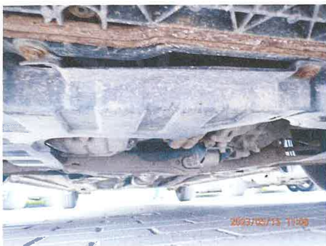
Fot. 25 P5150041