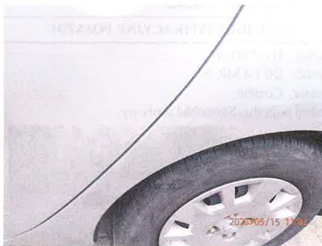
Fot. 6 P5150018