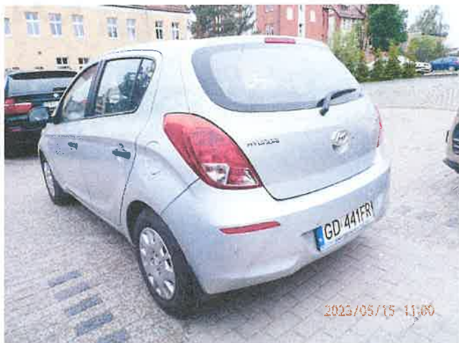
Fot. 3 P5150003