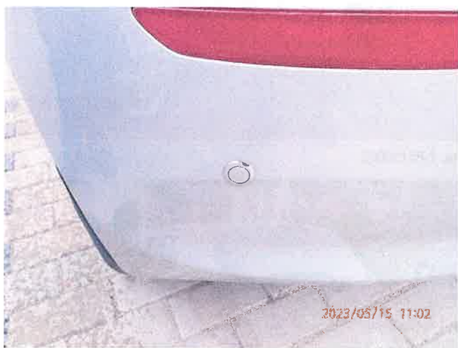
Fot. 7 P5150019