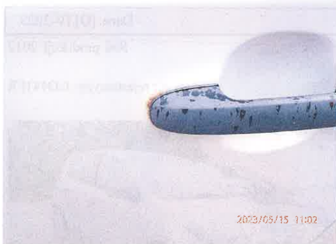
Fot. 5 P5150017