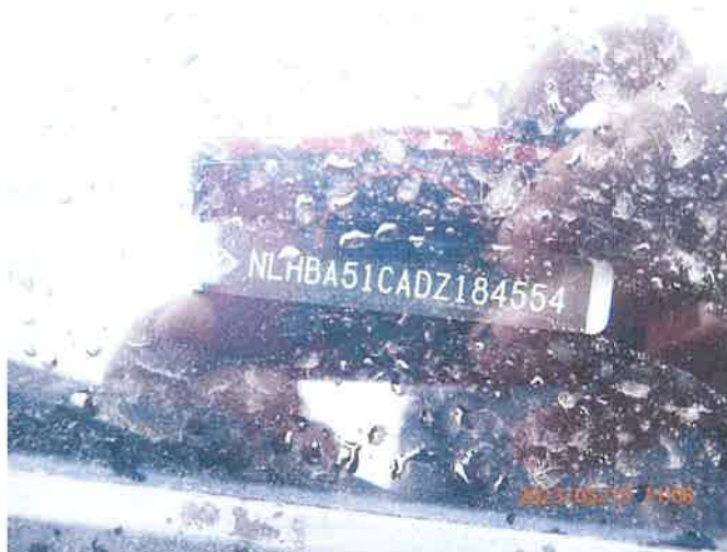
Fot. 26 P5150042