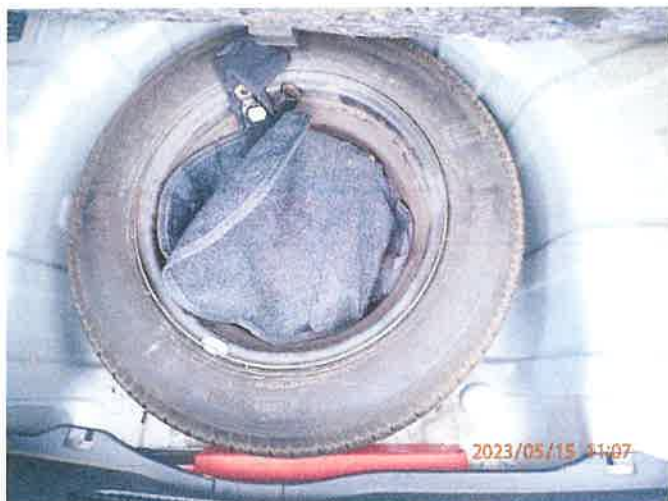
Fot. 23 P5150039