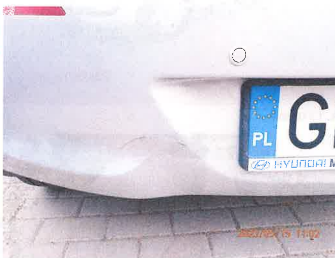
Fot. 8 P5150020