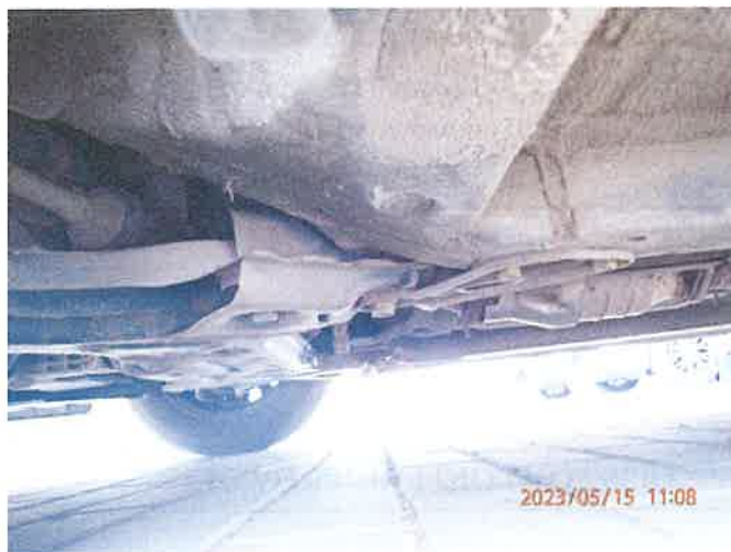
Fot. 24 P5150040