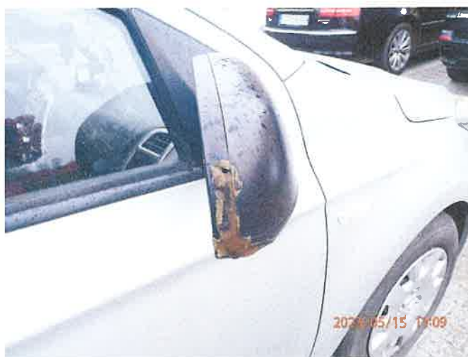
Fot. 28 P5150044

Biuro Rzecznictwa Samochodowego, Ruchu Drogowego, Wydział Maszyn i Urządzeń inż. Mirosław Kolomański 63-200 Skarżysko Główny System INFO-EKSPERT /SRTSiRD